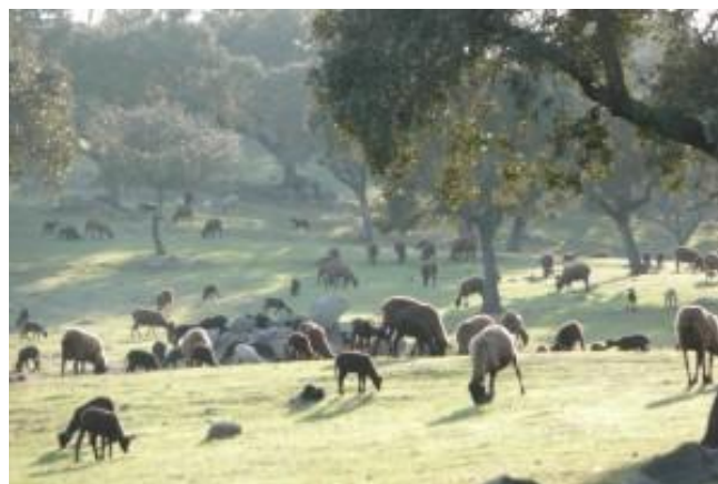
Moutons Mérinos Noir - Terra Dentro - Portugal