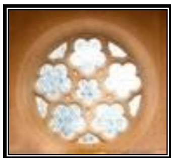
La rosace emblème des Bernardins

Ca fait du bien de retourner au collège et de retrouver le cœur de Paris ;